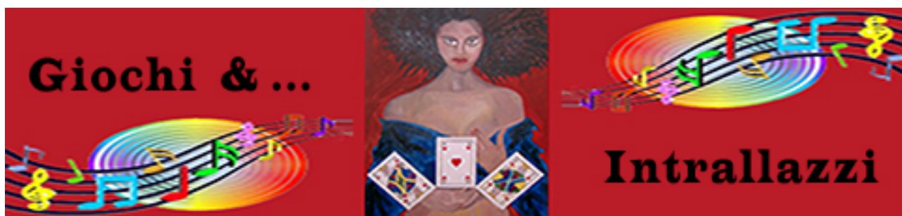
Orisol – La dama di cuori -2013

Ah, dimenticanza: è stata censurata anche la famosa White Christmas di Bing Crosby, sapete perché?... lo diremo giovedì sera.